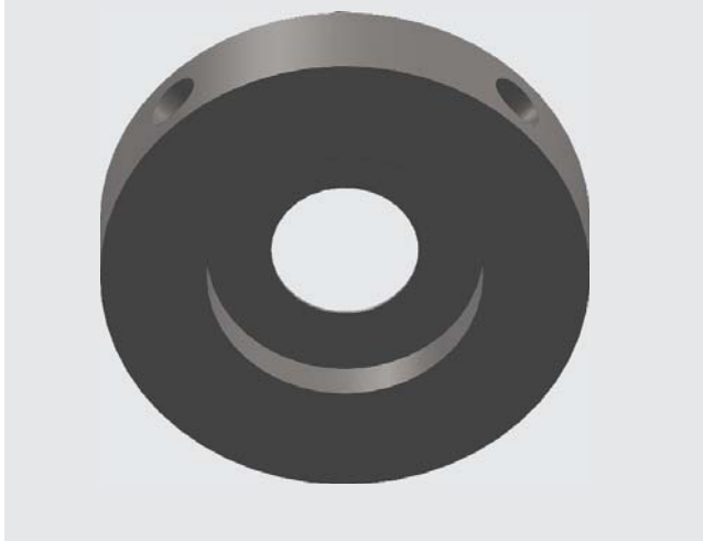
Корпус диафрагмы с отводами для отбора давления

По запросу может быть исполнение в зависимости от конкретных требований заказчика (например, измерение параметров пара через ниппель, резервуары для конденсата, клапаны)