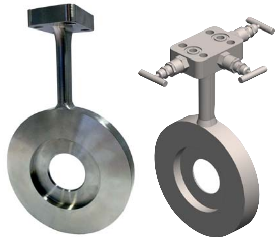
Рис. слева : Для непосредственного монтажа преобразователей дифференциального давления

Перепад давления, создаваемый первичным элементом измерения расхода, обычно преобразуется датчиком дифференциального давления в электрический сигнал, пропорциональный значению расхода.